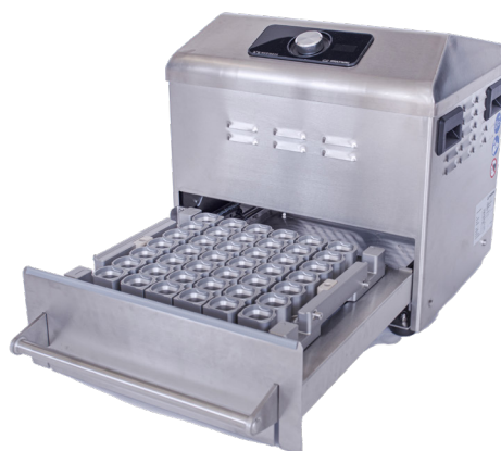
3000707: Medinox Sealing Unit + Trayholder 7 X 6