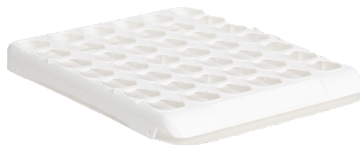
3000690: Medinoxx Meditray 7 X 6 Re-Use