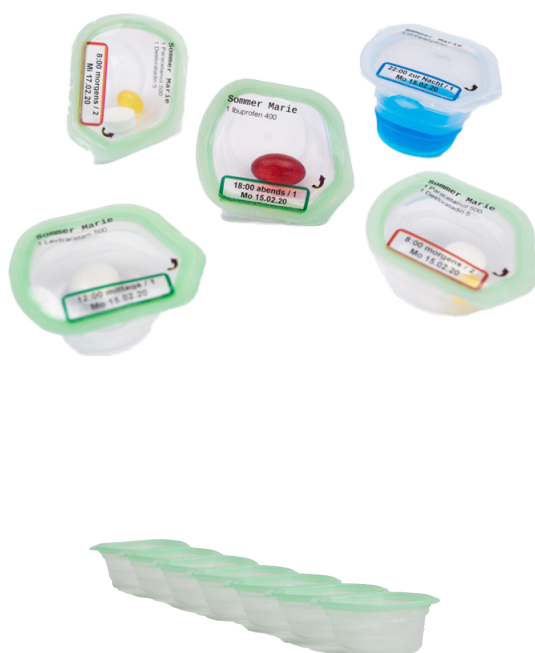
3000711: Medinoxx Medicup 10 ml (1 pc = 7 Medicups)