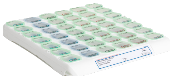
6002201: Medinox Seal 7 X 6 Printer