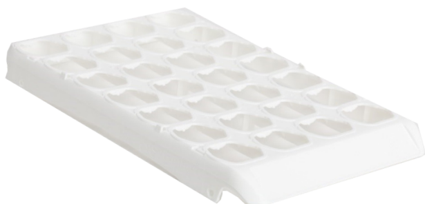
3000689: Medinoxx Meditray 7 X 4 Re-Use