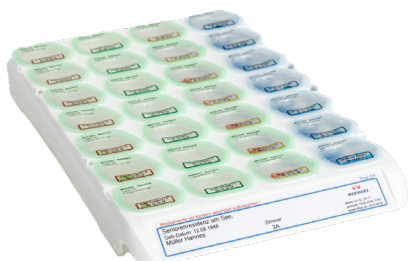
6002200: Medinox Seal 7 X 4 Printer