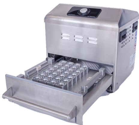
3000706: Medinox Sealing Unit + Trayholder 7 X 4