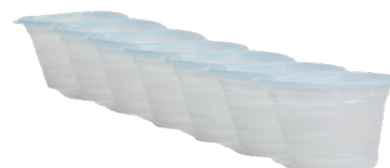
3000710: Medinoxx Medicup 15 ml (1 pc = 7 Medicups)